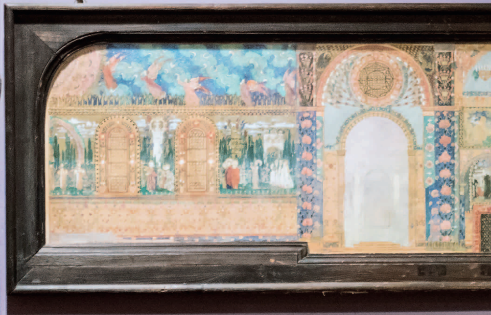
JÓZEF MEHOFFER Projekt polichromii do katedry p.w. Włodzimierza Wygniatki Maryi Panny w Płocku Polychrome design for the Cathedral of the Assumption of the Blessed Virgin Mary in Płock 1901